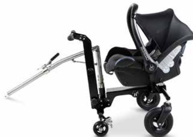
Connect Offroad family.

DAARNAAST KAN DE OFFROAD SERIE GOED GEBRUIKT WORDEN SAMEN MET ELEKTRISCHE ONDERSTEUNING OP DE HANDBEWOGEN ROLSTOEL.