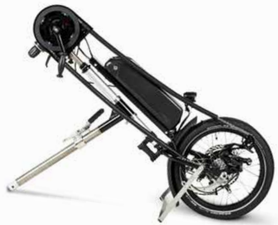
Runner Handbike Elektro kids.

KIES DE OPTIE ELEKTRO- ONDERSTEUNING VOOR NOG MEER COMFORT.