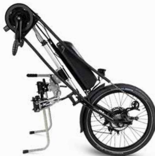
Runner Handbike Elektro Klick-Fix.

DE KLICK-FIX AANKOPPELING IS ZOWEL GESCHIKT VOOR DE HANDBIKE (ELEKTRO) ALS DE E-BIKE.