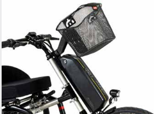
E-Bike met de optie: afneembare boodschappenmand.

DE ROAM E-BIKE BESCHIKT OOK OVER EEN ACHTERUIT-RIJFUNCTIE, HIERMEE IS DE E-BIKE IDEAAL VOOR DE BINNENSTEDEN EN VER DAARBUITEN!