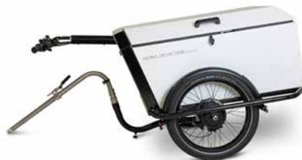
Connect Carrier Cargo met aluminium bak.

DAARNAAST IS DE CARRIER CARGO OOK EEN ZEER GESCHIKT MOBILITEITSMIDDEL VOOR IN DE VRIJE TIJD.