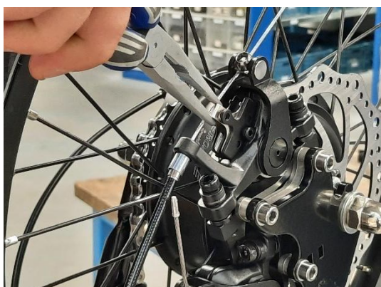
3. verwijder de schijfremblokjes