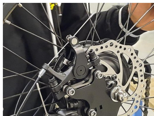
6. plaats borging (splitpen) terug en buig de pootjes stel als laatste de remklauw opnieuw af