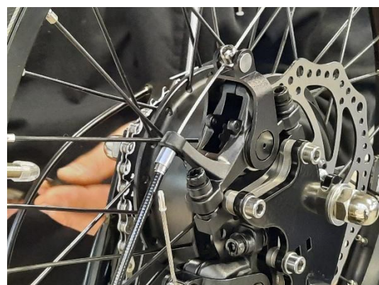
4. plaats de vervangende blokjes op dezelfde plek