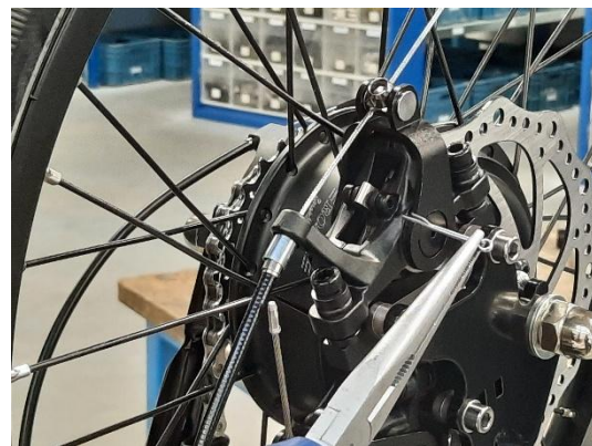
2. verwijder de borging (splitpen)