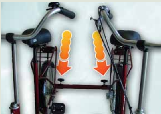
Foto 3: middels een koker en twee sterknoppen worden de fietsen met elkaar verbonden.