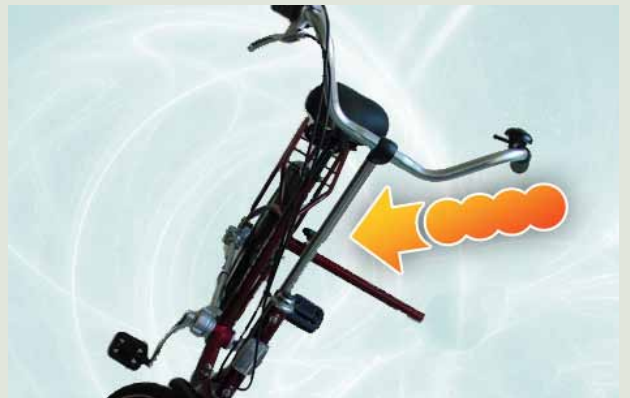
Foto 4: draai de laatste sterknop los om de koker te kunnen verwijderen